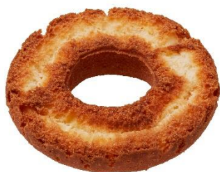
オールドファッション