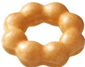
ポン・デ・リング