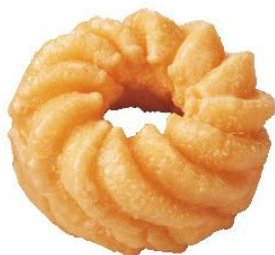
フレンチクルーラー